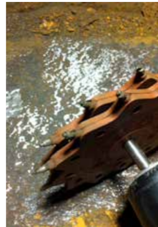
Verwijderen van roest