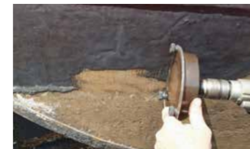
Verwijderen van teer