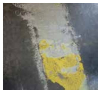
Verwijderen van belijning op betonnen fabrieksvloer