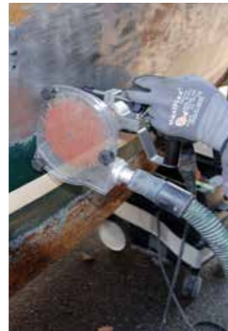
Verf verwijderen met afstandhouder en afzuigkap