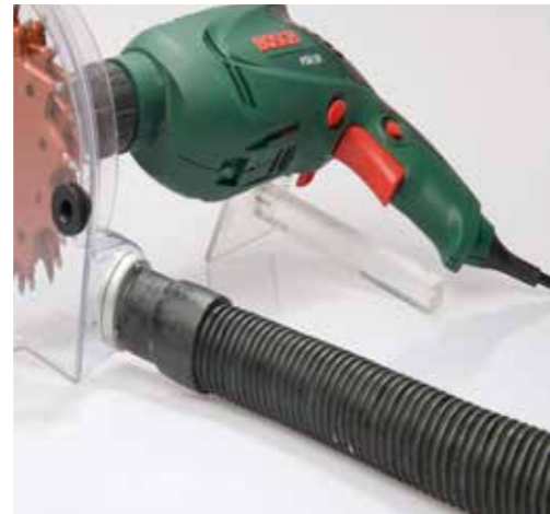
Aansluiting afzuiging op afzuigkap

Uiteraard zijn de beide hulpstukken ook samen te gebruiken. Vooral bij het verwijderen van een gelcoat is dit noodzakelijk omdat hierbij veel stof vrijkomt.