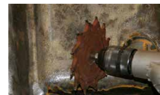
Verwijderen van tectyl