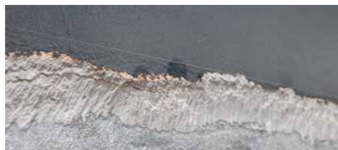
Verwijderen van dikke lagen plamuur