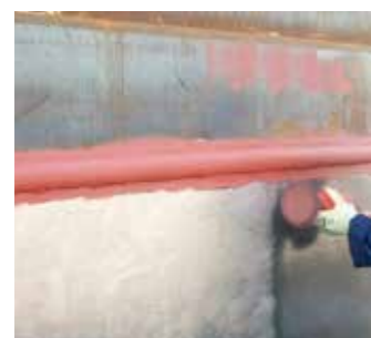
Verwijderen van walshuid

Met andere woorden: het maakt niet uit wat de verontreiniging is, Tercoo® maakt het altijd schoon.